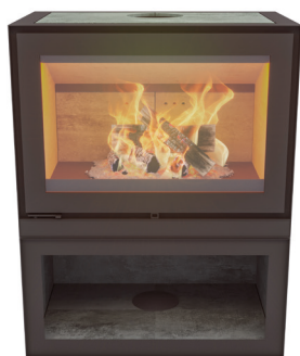
MAX W DEPOT