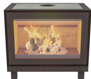
MAX W POOTJES