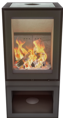
MAX H DEPOT