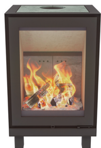
MAX H POOTJES