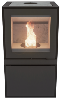
Max B Pellet Naturel