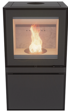
Max B Pellet Zwart