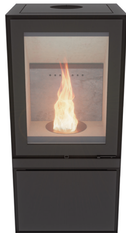
Max H Pellet Zwart