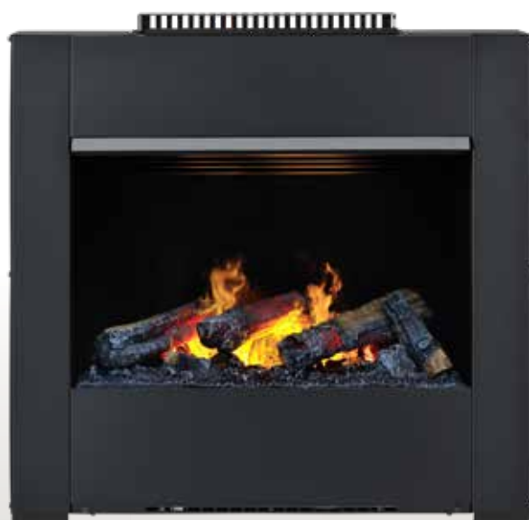
Wall fire engine L 210203 / 5011139210203