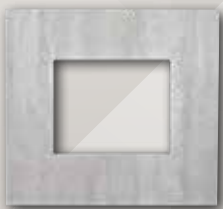
Nissum concrete S & L 207821 (S) / 207838 (L) 5011139207821 (S) 5011139207838 (L)