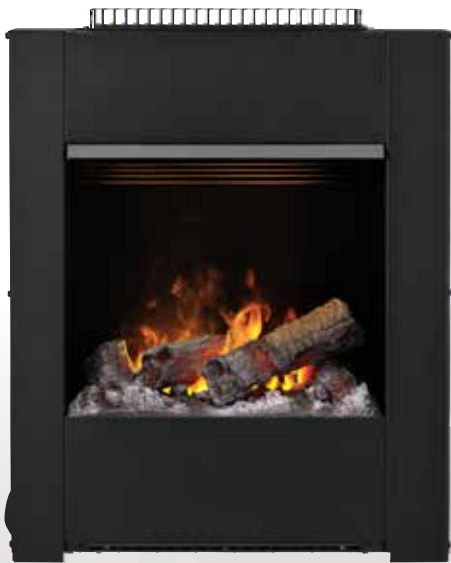
Wall fire engine S 210180 / 5011139210180