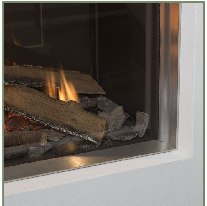
Afbeelding 3 - Voorbeeld RVS lijst