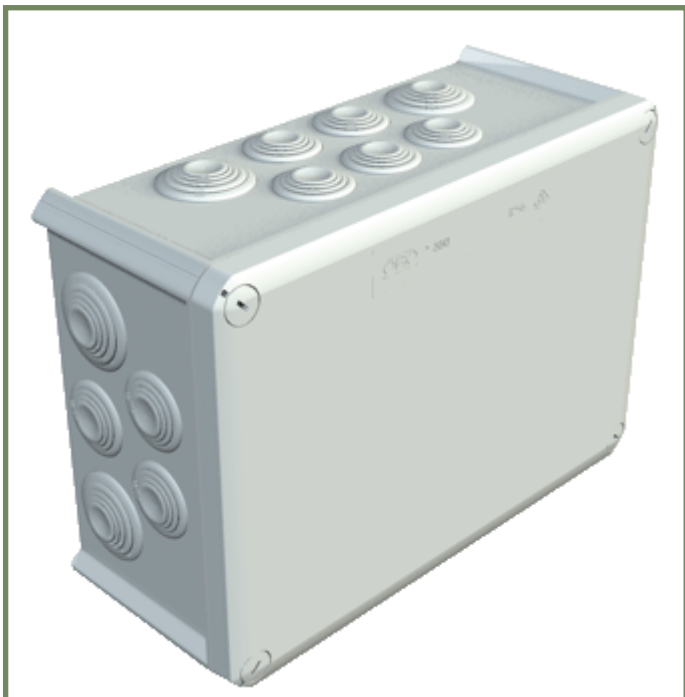
Afbeelding 2 - Montagedoos zoals geleverd bij de haard